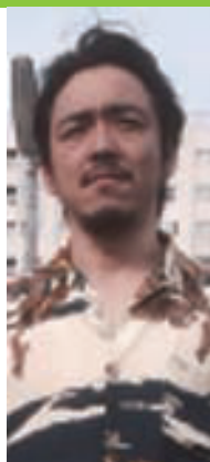
俳優 川本三吉 1975年2月5日生